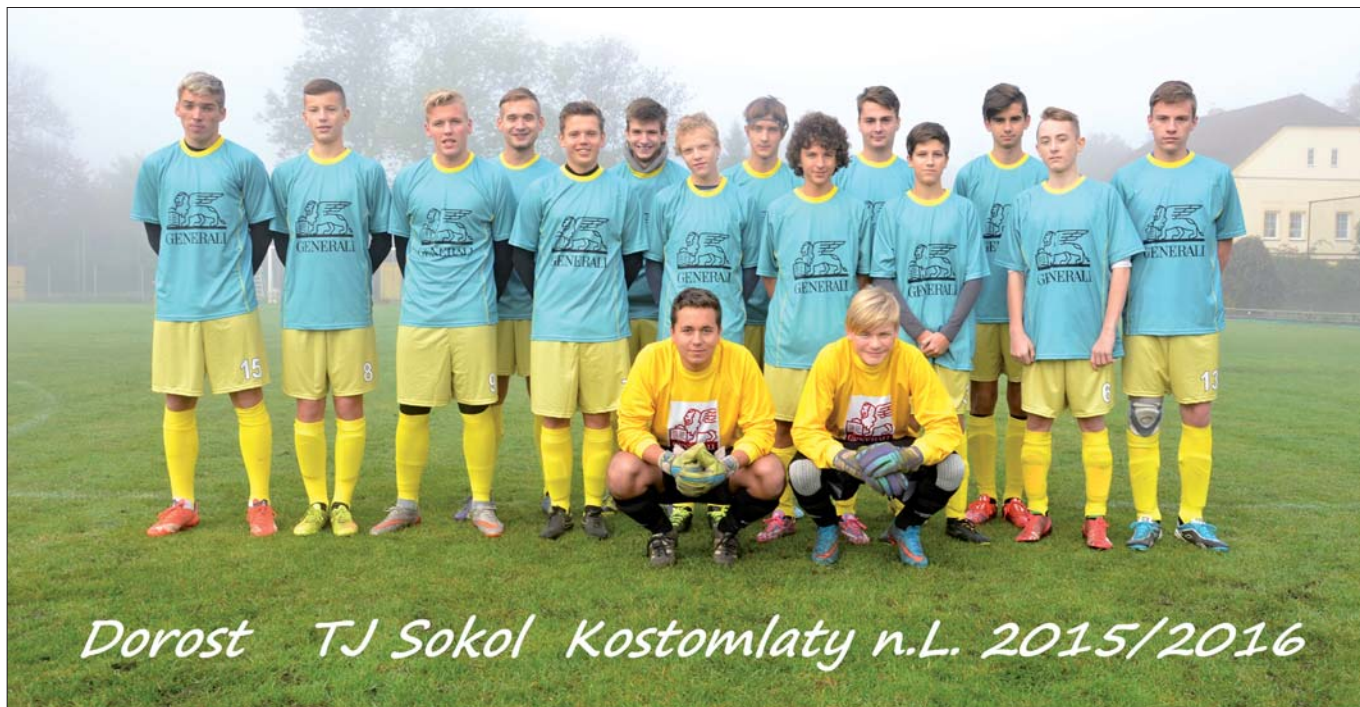
Dorost TJ Sokol Kostomlaty n.L. 2015/2016

Dorost Kostomlaty n. Lab. nastoupil v nových dresech na zápas s Chotětovem 24. 10.2015