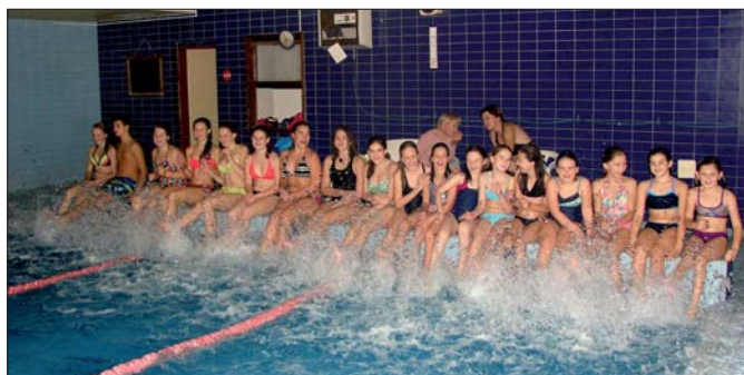
Kostomlatký volejbalový klub se zúčastnil volejbalového soustředění ve Sportcentru Brandýs nad Labem ve dnech 13. - 14. 11. 2015