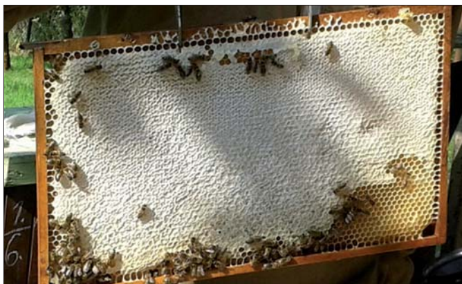
Rámek se zavíčkovaným medem.