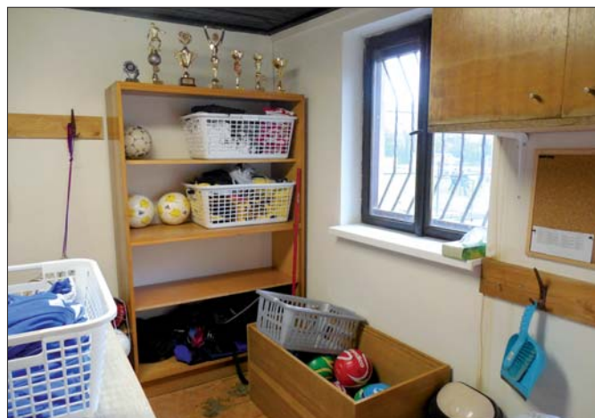
Nově upravená kabina přípravky.