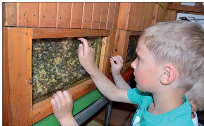
Malý pozorovatel si prohlíží plodiště.